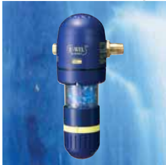
JU-WEL Amethyst Juwelierungsgerät fürs ganze Haus. Mit Amethyst.