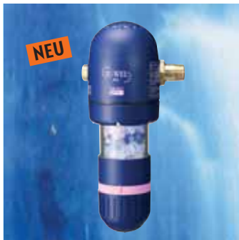
JU-WEL Trio Juwelierungsgerät fürs ganze Haus. Mit Amethyst, Bergkristall und Rosenquarz.