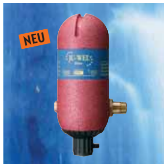
JU-WEL Klima Juweliert Ihr Heizungswasser mit Amethyst und wirkt so positiv auf das Raumklima ein. Für Wohlbefinden und ganzheitliche Lebensqualität. Ergänzt ideal JU-WEL-Trinkwassergeräte.