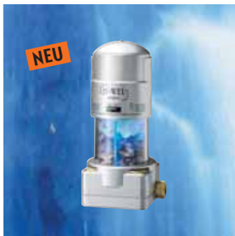
JU-WEL Compact Untertisch-Juwelierungsgerät für den Wasserhahn. Mit Amethyst, Bergkristall und Rosenquarz.

Juweliertes Wasser wirkt positiv auf den ganzen Organismus – belebend, hilft gegen Stress und sorgt für ganzheitliches Wohlbefinden.