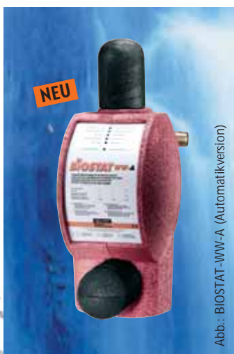
Abb.: BIOSTAT-WW-A (Automatikversion)

Komfortabel durch manuelle oder automatische Rückspülung. Leichte Bedienung, nachvollziehbare Wirkung, wirtschaftlicher Betrieb und geringe Folgekosten sind gute Argumente, die jeden Hausbesitzer überzeugen.