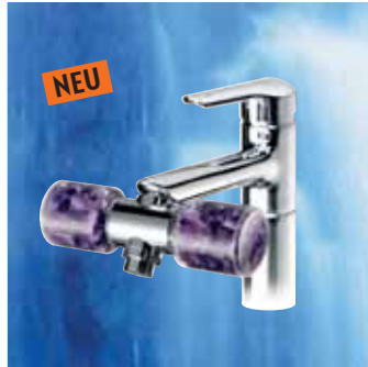
JU-WEL Vario Juwelierungsgerät mit Amethyst, für den Wasserhahn. Klarsicht- Flakoset zum Wechseln. Weitere Heilsteine zur Auswahl.