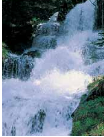
Der Bergbach, Sinnbild für Frische und Reinheit des Wassers.