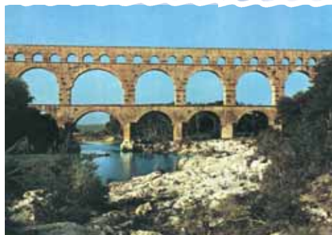
Aquädukt Pont du Gard