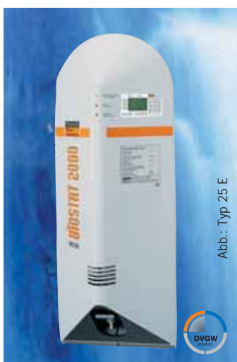
Abb.: Typ 25 E