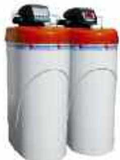
JM 2 - 3 WZ-D