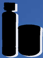
Manuell bediente Einzelanlagen