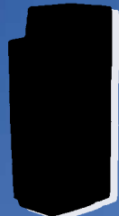
Kabinettanlagen mit veränderter Optik und gleicher Technik