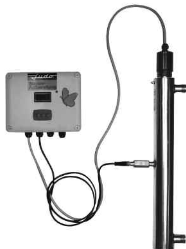
Modell JUV G/GS