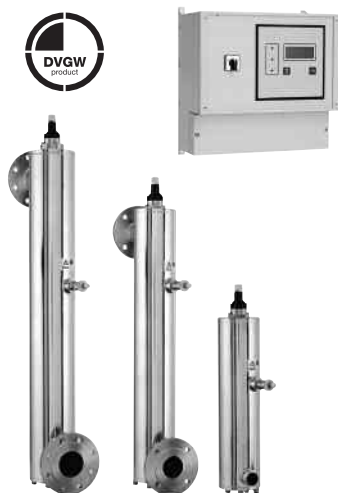
Modell JUV 40 – 130 WW