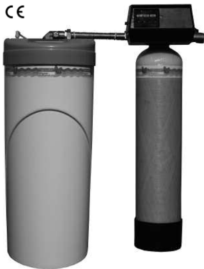
Abb.: JM 2-3 D

Überall dort, wo niedrige Investitionskosten und geringe Betriebskosten im Vordergrund stehen, bietet diese Baureihe das Optimum.