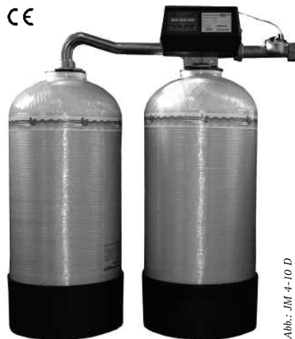
Abb.: JM 4-10 D

Verrohrung und automatischer Umschaltung auf den in Reserve stehenden Behälter.