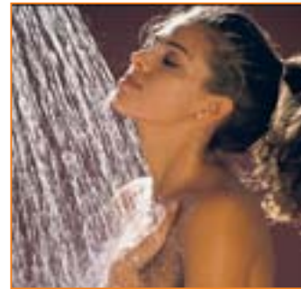
MIT BIOSTAT-COMBI macht Duschen und Baden doppelt Spaß.