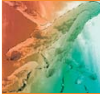
Legionella pneumophila (Abb. stark vergrößert)